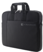
Laptop-Tasche B116 (PX1880E-2NCA)