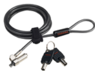
Ultra flaches Kabelschloss (PA5364U-1KCL)